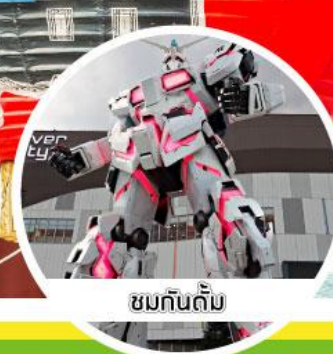
ชมกันดั้ม