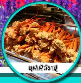
บุฟเฟ่ต์ซาปู