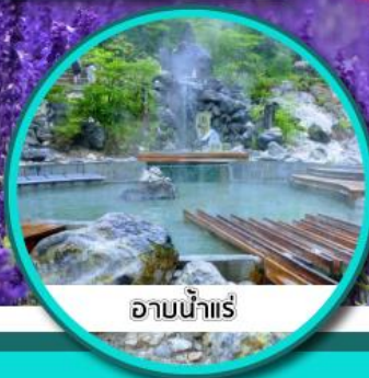
ออนน้ำแร่