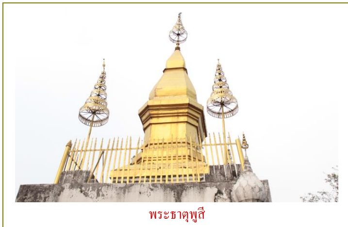
พระธาตุภูสี