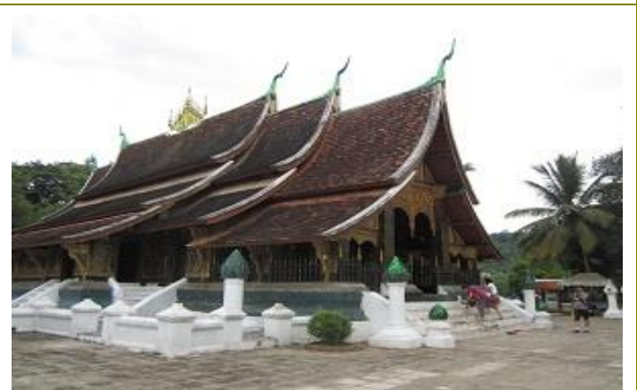
วัดเชียงทอง