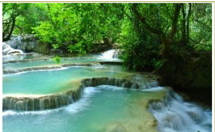
น้ำตกกวางสี