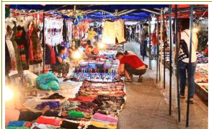
บรรยากาศตลาดกลางคืน