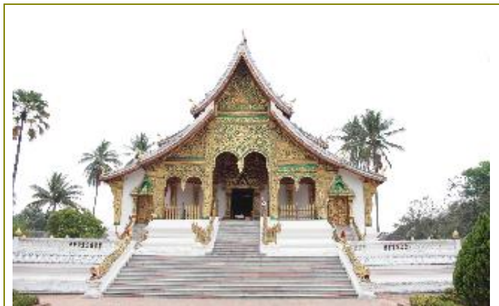
พระราชวัง และ หอพิพิธภัณฑหลวงพระบาง