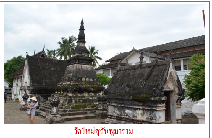
วัดใหม่สุวรรณภูมาราม