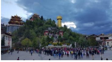
ค่ำ ที่พัก

นานาชนิด ด้วยภูมิประเทศรวมกับทัศนียภาพที่งดงาม สถานที่แห่งนี้จึงได้ชื่อว่า "ดินแดนแห่งความฝัน" ระหว่างทางแวะชม โค้งแรกแม่น้ำแยงซีเกียง (ฉางเจียงตี้ยิวาน) เกิดจากแม่น้ำแยงซีที่ไหลลงมาจากชิงไห่และทิเบต ซึ่งเป็นที่ราบสูงไหลลงมากกระทบเขาให้หลอ แล้วหักเส้นทางโค้งไปทางทิศตะวันออกเฉียงเหนือ จนเกิดเป็น "โค้งแรกแม่น้ำแยงซี" ขึ้นจากนั้นชม ช่องแคบเสือกะโจน ซึ่งเป็นช่องแคบช่วงแม่น้ำแยงซีไหลลงมาจากจินชาเจียง(แม่น้ำทรายทอง) เป็นช่องแคบที่มีน้ำไหลเชี่ยวมาก ช่วงที่แคบที่สุดประมาณ 30 เมตร ตามตำนานเล่าว่า ในอดีตช่องแคบเสือกะโจนสามารถกระโดดข้ามไปยังฝั่งตรงข้ามได้ จึงเป็นที่มาของ "ช่องแคบเสือกะโจน" นำชมเมืองโบราณ แชงกรีล่า เป็นศูนย์รวมของวัฒนธรรมชาวทิเบตลักษณะคล้ายชุมชนเมืองโบราณทิเบต ซึ่งเต็มไปด้วยร้านค้าของคนพื้นเมืองและร้านขายสินค้าที่ระลึกมากมาย