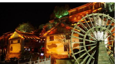
ค่ำ ที่พัก